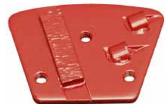
PCD SPLIT segment