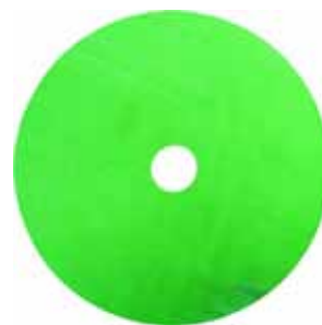
Glad Olie Disk TZ

Door gebruik te maken van de Glad Olie Disk kunnen vloeren afgewerkt worden in 1 laag! Het oppervlak is direct verzadigd, slijtvast, zijdezacht en eenvoudig te onderhouden.